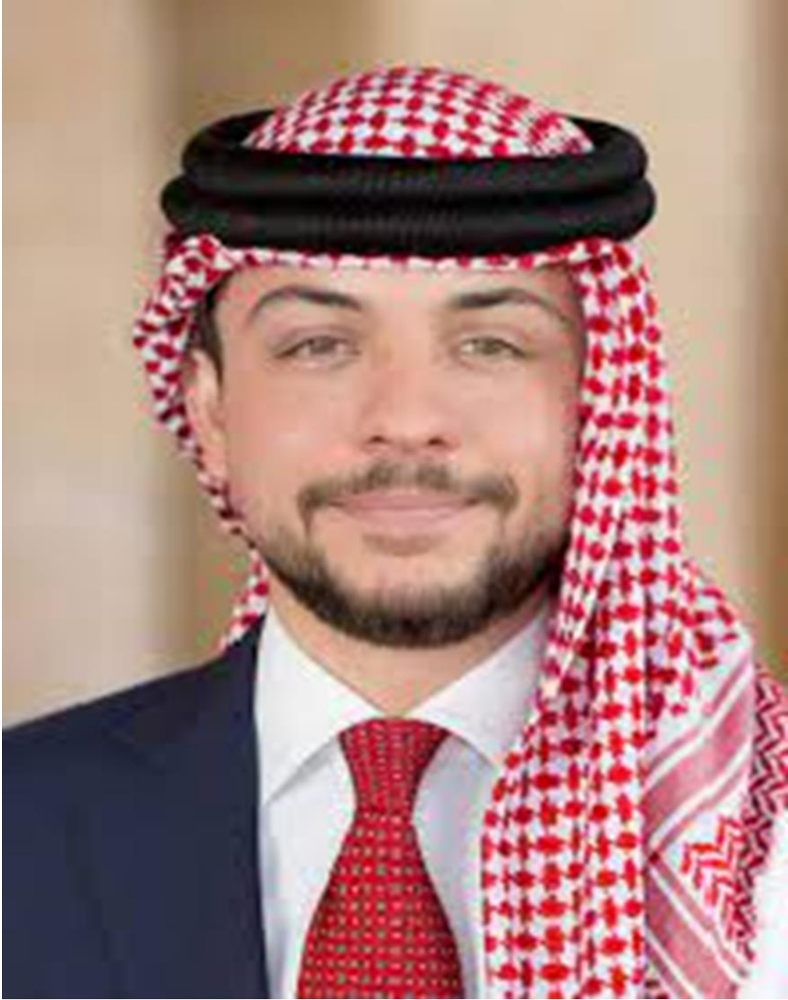
حضرة صاحب السمو الملكي الأمير حسين بن عبدالله الثاني ولي العهد المعظم