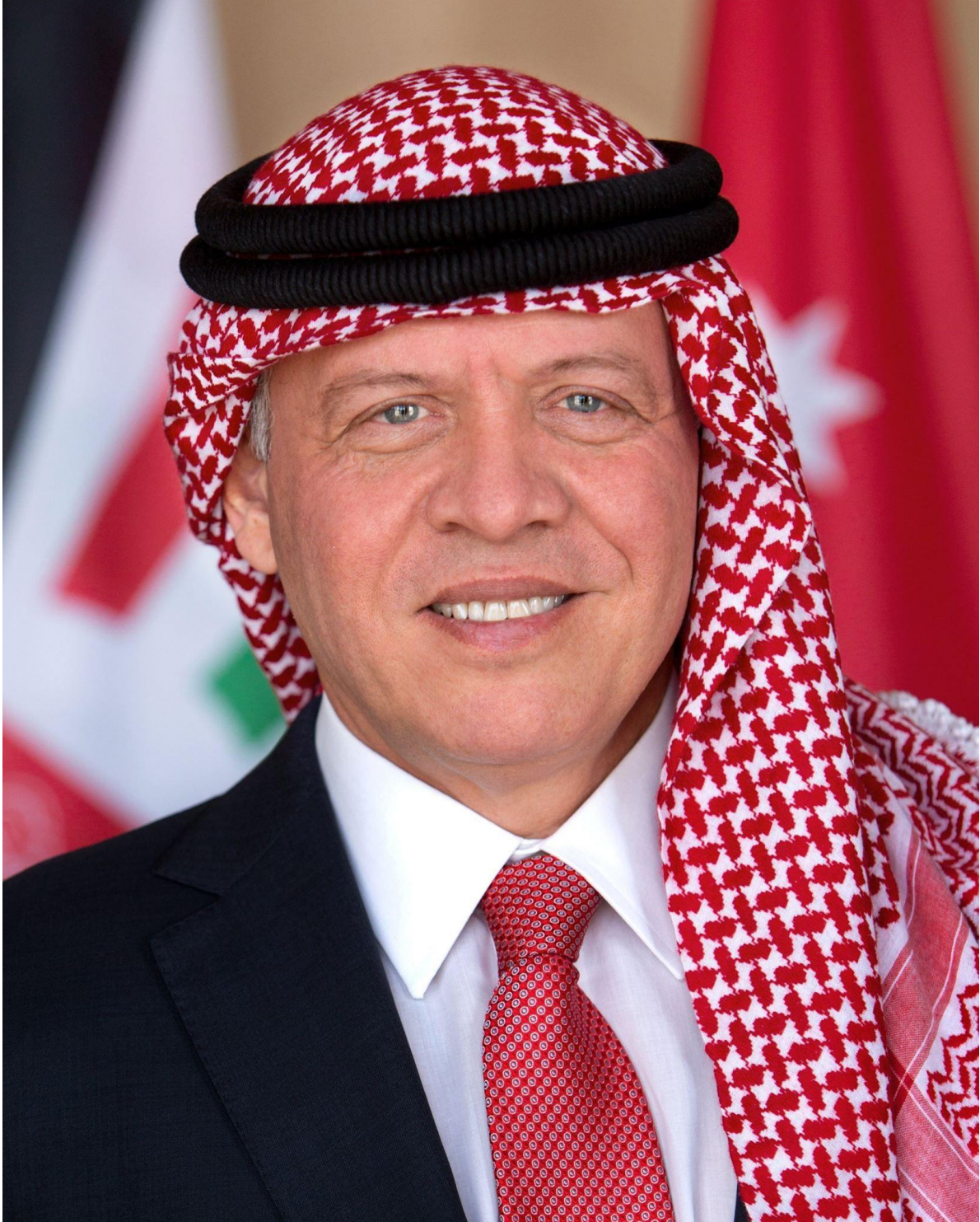
حضرة صاحب الجلالة الملك عبدالله الثاني ابن الحسين المعظم